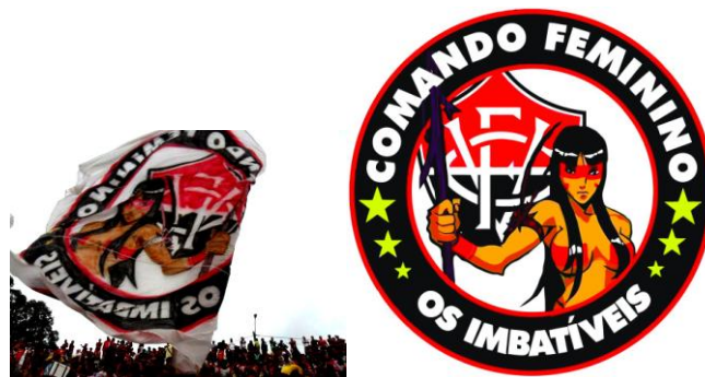
Figura 4: Símbolo do Comando Feminino da TUI