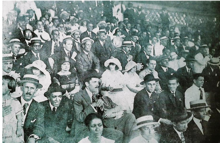
Figura 1: Presença feminina nas arquibancadas em um jogo entre os clubes do Bahiano de Tênis e Vitória, em 1926.