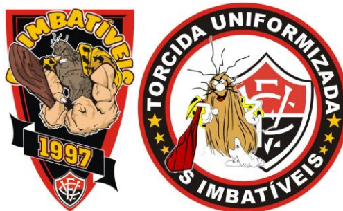
Figura 3: Símbolo da Torcida Uniformizada Os Imbatíveis

Guerreira, né? Na verdade, primeiro que foram os habitantes iniciais aqui do Brasil, são mulheres guerreiras que lutam com suas armas próprias, pra poder defender suas tribos e seus objetivos. E o objetivo da representação da índia é esse aí. (Entrevistada Organizada 02)