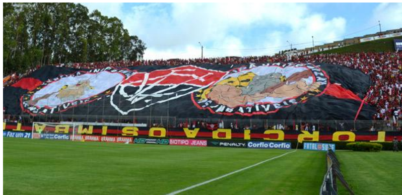
Figura 5: Faixa da TUI de cabeça para baixo como forma de protesto

Dentro do estádio há uma divisão territorial entre as torcidas do Vitória, demarcadas por faixas. As faixas acompanham os torcedores organizados também nas caravanas e jogos fora de Salvador, sendo uma forma de “representar” a torcida e comprovar que ela se faz presente e apoia o time em qualquer lugar, o que confere reconhecimento. As faixas viradas ou de “cabeça para baixo” é uma forma de protesto e expressar descontentamento por alguma circunstância. (Figura 5) No dia 24 de novembro de 2012, dia que marcaria o retorno do Vitória a primeira divisão do Campeonato Brasileiro, um dos momentos mais aguardados pelos torcedores era a virada da faixa da TUI, que se manteve de ponta-cabeça até o retorno do clube a série A, como forma de protestar diante da queda do time para a segunda divisão.