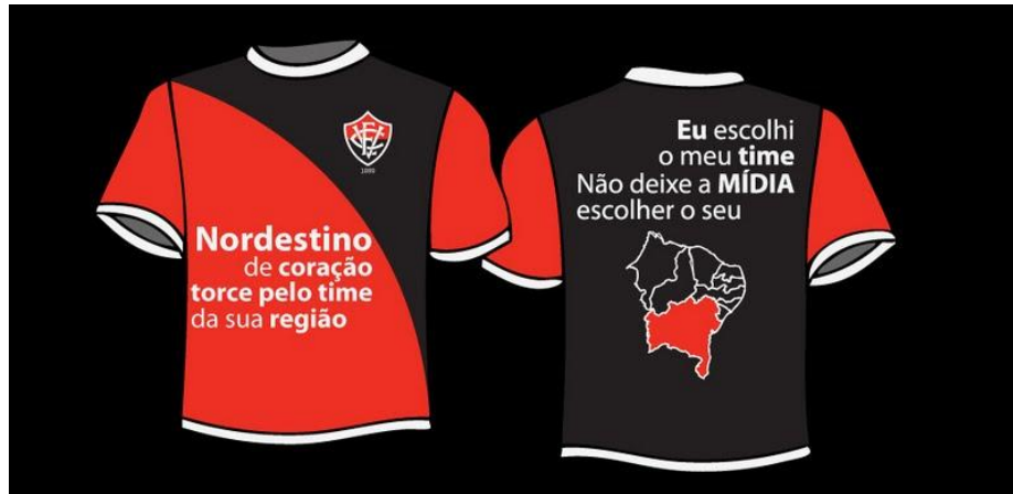
Figura 17: Campanha de torcedores buscando valorizar os times nordestinos

A reclamação sobre uma suposta parcialidade de algumas emissoras televisivas locais também aparece no discurso das entrevistadas. Conforme afirma outra torcedora: “A Globo é literalmente Tv de Tricolor. É visivelmente tricolor.” (Torcedora Organizada 06)