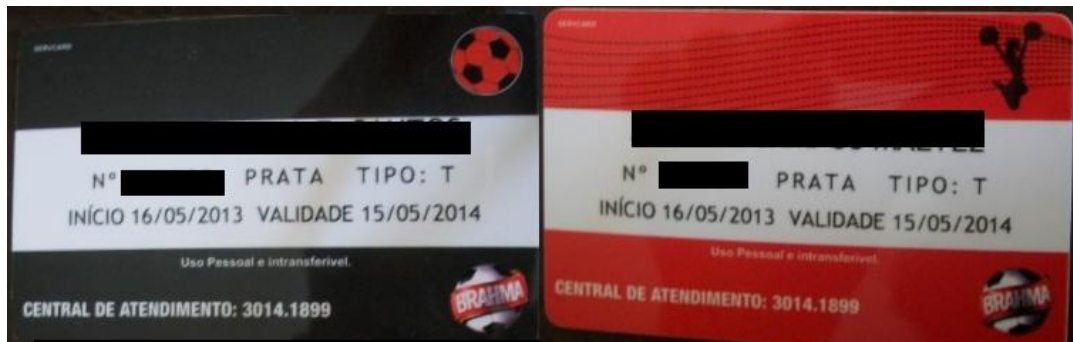
Figura 12: Cartões de associados do Esporte Clube Vitória do sexo masculino e feminino

O cartão de associado do Esporte Clube Vitória, talvez possa passar despercebido ou até agrade a maioria do público, entretanto, fica claro a distinção das figuras no cartão feminino e masculino. Às mulheres cabe o desenho da animadora da torcida, aos homens destina-se a bola de futebol. (Figura 12)