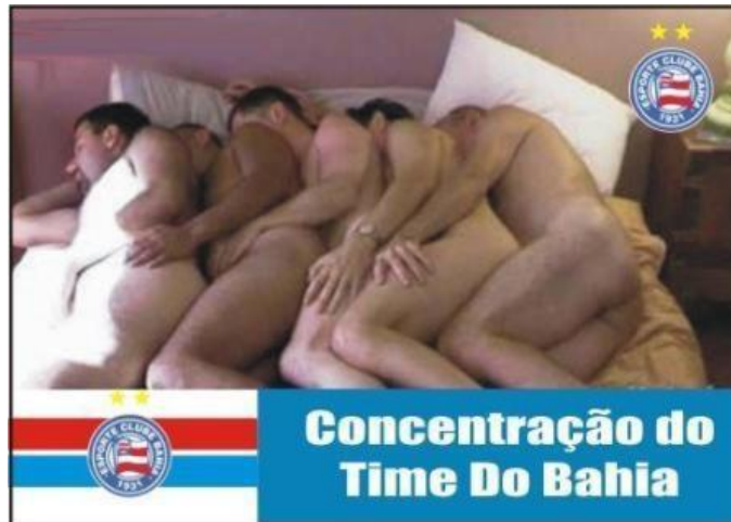
Figura 9: Montagem compartilhada por torcedores em ambientes virtuais como forma de gozação