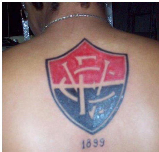
Figura 14: Tatuagem de uma integrante da TUI

Neste sentido, o corpo ocupa um lugar central como objeto de representação e identidade do indivíduo, isto é, o fato de ser tatuado aparece como um caminho de inscrever nos corpos algo que o distingue dos demais e o identifica. (PERÉZ, 2006) Em outras palavras, [...] as modificações corporais podem ser entendidas como formas pelas quais os sujeitos revelam sua presença no mundo, são tipos de assinaturas de si mesmos e que ajudam a afirmar a sua singularidade (LE BRETON, 2002, p. 165 apud PERÉZ, 2006).