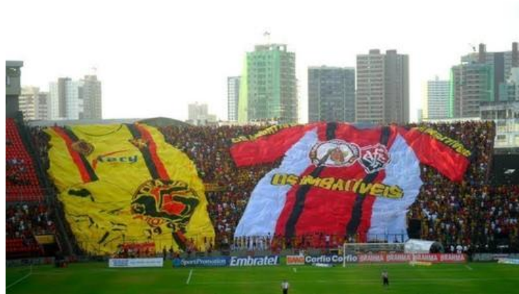
Figura 6: Bandeiras unidas representando a aliança entre a TUI e a Torcida Jovem do Sport em Recife

nas arquibancadas e alguns relatos afirmaram que o torcedor havia rasgado a bandeira e acabou sendo repreendido de forma dura por integrantes, homens e mulheres, da torcida organizada em questão, o que acaba por reforçar a ideia de que os espaços do estádio guardam suas peculiaridades e exigem padrões de condutas distintos.