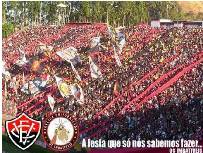
Figura 8: Festa da TUI nas arquibancadas do Barradão

Seguem as impressões sentidas e registradas no diário de campo durante as observações e a participação no estádios Barradão: