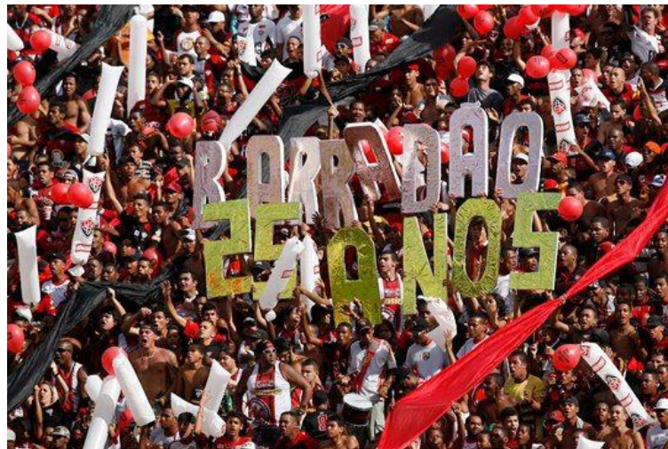
Figura 2: Torcedores preparam festa para comemorar o aniversário do Estádio Manoel Barradas

O Estádio Manoel Barradas, mais conhecido como Barradão, localiza-se no bairro de Canabrava em Salvador. Motivo de orgulho para os torcedores, as denominações “santuário” e “casa” são largamente utilizadas para se referir ao local. Embora existam muitas queixas dos seus frequentadores, com relação ao difícil acesso ao estádio, transporte, engarrafamentos nos arredores e assaltos, é amplamente notado o carinho que os mesmos possuem com o local, atribuindo a ele um valor quase que sagrado e uma extensão da própria residência. Inclusive o fato de “ter uma casa”, de ter um estádio, é motivo de demonstrar superioridade sobre o adversário que não possui estádio próprio. A ligação dos torcedores com o espaço é forte e comumente, na disputa e rivalidade futebolística, o estádio do time adversário também é alvo de desqualificação, sendo, muitas vezes, apelidados de forma depreciativa.