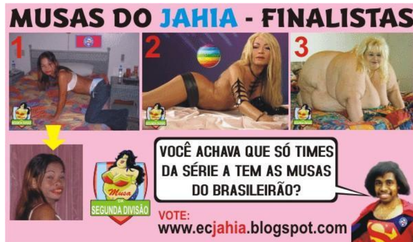
Figura 13: Montagem feita por torcedores com intuito de desqualificar a torcida rival

Percebe-se que neste contexto, constrói-se sobre a figura feminina “[...] uma narrativa que ressalta a beleza, a graciosidade e a sensualidade como seus maiores atributos, reforçando, portanto, uma representação hegemônica de feminilidade” (GOELLNER, 2005, p. 148)