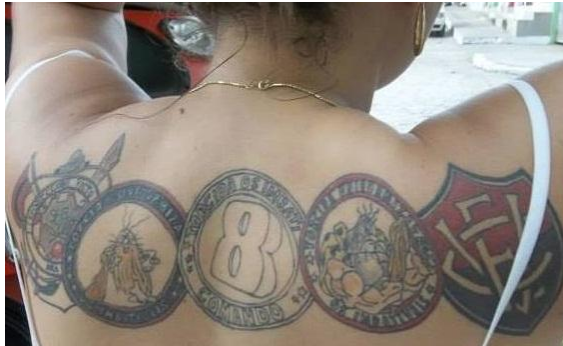
Figura 15: Tatuagem de uma integrante da TUI