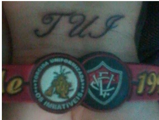
Figura 16: Tatuagem de uma integrante da TUI