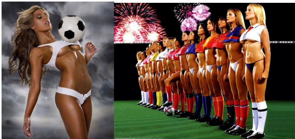
Figura 11: Fotos que aparecem no buscador Google ao colocar as palavras “mulher” e “futebol”

As palavras “mulher e futebol” são associadas comumente quando os torcedores querem se referir as suas duas “paixões nacionais”. Não sendo raro encontrar imagens que fazem tal associação ao colocar mulheres seminuas utilizando artigos do esporte, imagens divulgadas, principalmente, em ambientes virtuais ou propagandas televisivas. (Figura 11) Uma breve pesquisa no buscador de imagens do site Google colocando as duas palavras citadas comprova o fato: